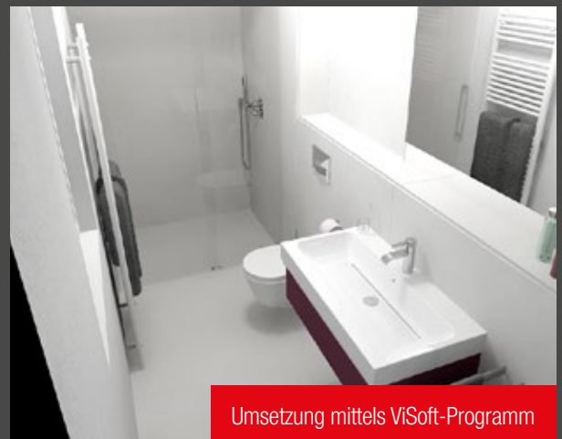
Umsetzung mittels ViSoft-Programm