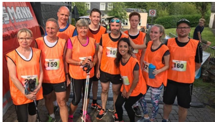
Unser Laufteam für eine der schönsten und familienfreundlichsten Laufveranstaltungen im Bergischen.

Am 22.06.2019 hieß es in Dhünn wieder auf die Plätze, fertig, los! Mit unserer Hausmann Regendusche im Zieleinlauf und Sachspenden für die Tombola unterstützen wir jährlich diese sportliche Veranstaltung. Wir sind wieder mit motivierten Mitläufern an den Start gegangen und konnten einen 1. und 2. Platz im 3-Km-Lauf erzielen.